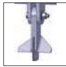
Coltelli "Verticut 70 mm" "Verticut" knives 70 mm Couteaux "Verticut" 70 mm "Verticut" Messer 70 mm Cuchillos "Verticut" 70 mm