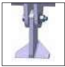
Coltelli doppi Double knife Double couteaux Doppelmesser Cuchillo doble