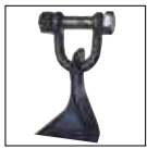
Coltelli a spatola Paddle knives Couteaux à cuillère Spachtelmesser Cuchillos a espátula