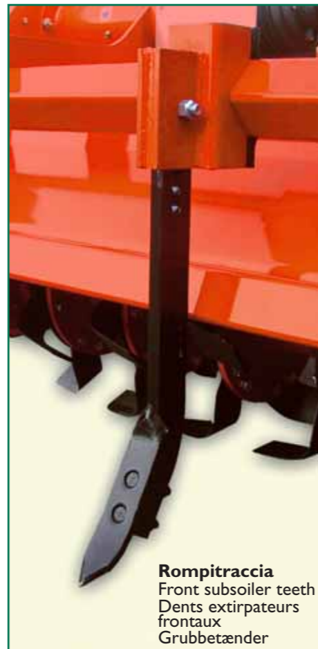
Rompitraccia Front subsoiler teeth Dents extirpateurs frontaux Grubbetænder

La sede della MURATORI si trova su un'area di 16.000 m 2 (di cui 6.000 m 2 coperti); in questo stabilimento vengono prodotti: ERPICI ROTANTI, FRESATRICI, FRESE INTERRASASSI, TRINCIATRICI (per erba, sarmanti, paglia ecc.) e RASAERBA. Le macchine MURATORI sono utilizzate nel giardinaggio, nella cura del verde, nell'agricoltura specializzata, nelle grandi estensioni e vengono correntemente esportate in oltre trenta paesi di cinque continenti.