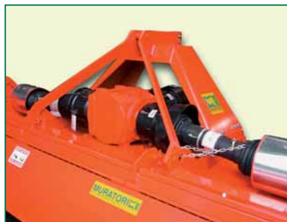
Doppia trasmissione Double transmission Double transmission latérale Dobbelt transmission