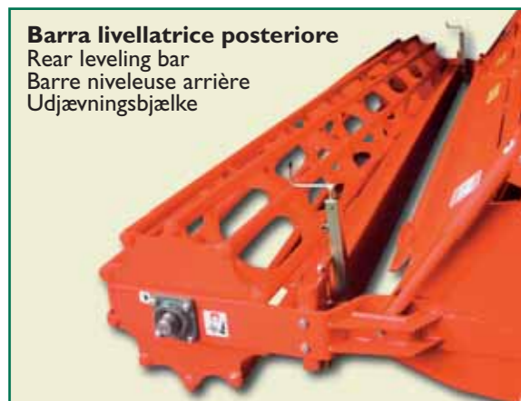
Barra livellatrice posteriore Rear leveling bar Barre niveleuse arrière Udjævningsbjælke